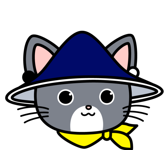
図 1: すーりん

multicols 環境の中で figure 環境や table 環境を使う場合、here パッケージを読み込んでオプション H を付与するとうまくいくようです。図を横に並べる方法は複数ありますが、図 1-3 のようにするというのが 1 つの例です (ちなみに、すーりんたちの画像は http://seam.ism.ac.jp:8080/kouhou-iinkai/newcharacter.html からダウンロード可能です)。ベクタ形式の画像は EPS 形式で用意しても構いませんが、最近の L A T E X 環境では PDF 形式の画像を扱うことができます。ラスタ形式の画像は PNG 形式や JPG 形式などで用意するとよいでしょう。