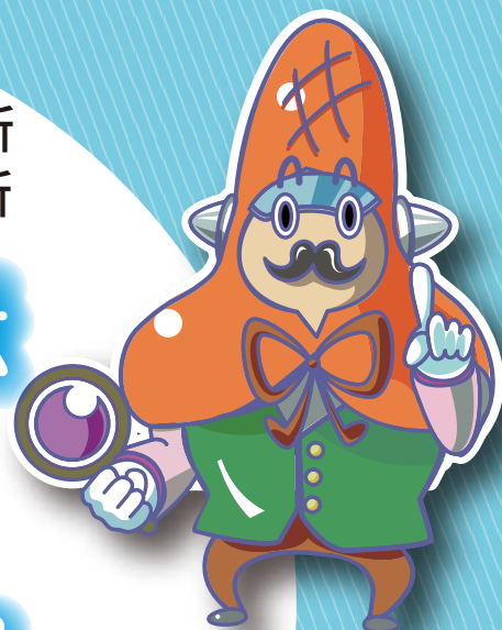
▲トースター (統数研キャラクター) ▼スタッツ