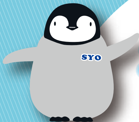
ショータ▲ (極地研キャラクター) ポール▼