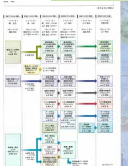
新しいリスク解析戦略研究センターのパンフレット (P.1-2)