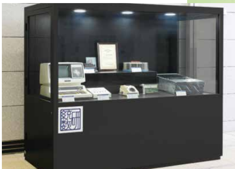
統計数理研究所 1 階の交流アトリウムの常設展示 (* コロナ禍のため、現在一般の方の入場は制限しております)