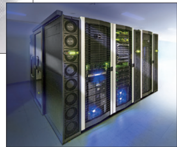
共用クラウド計算システム「C」