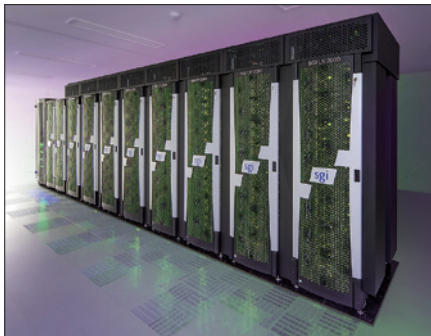
データ同化スーパーコンピュータシステム「A」