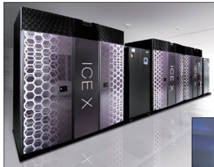
統計科学スーパーコンピュータシステム「I」